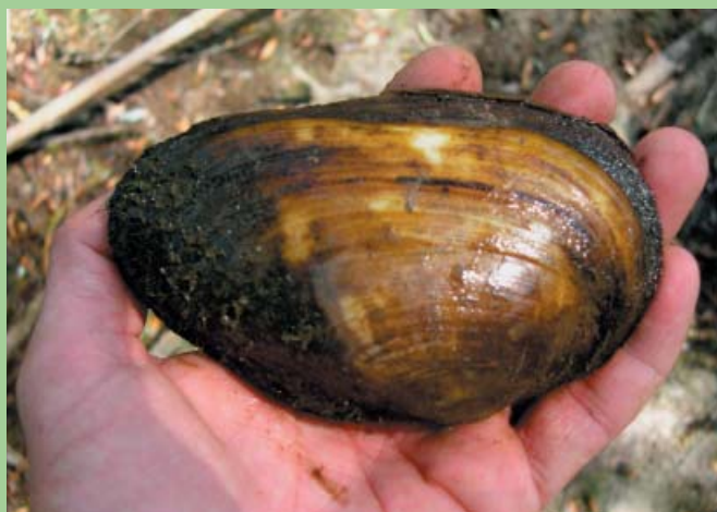
Exemplar de nàiada anodonta ( Anodonta cygnea )

L'espècie es troba en regressió a tot arreu per la contaminació de les aigües, la disminució de les comunitats de peixos autòctons i la substitució dels fons naturals de canals, regs i rius on viuen per materials artificials.