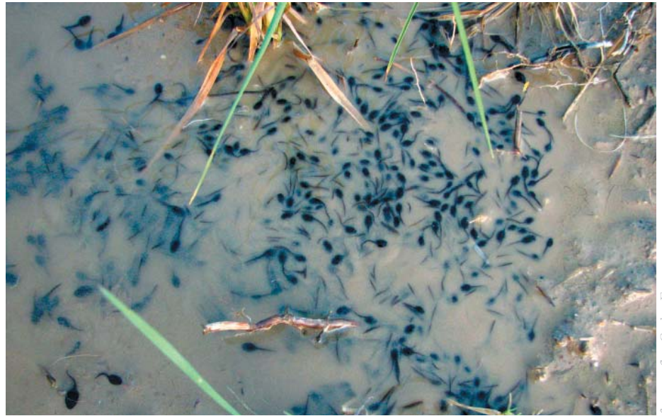
Larves de gripau corredor a la closa de Can Mascort

En una de les zones inundables de la closa es va instal·lar un tancat provisional al seu voltant format per una tela vertical que impedia la sortida o entrada a la bassa de qualsevol amfibi. A banda i banda d'aquesta tela, per dins i per fora, i situats cada 20 metres es van enterrar uns cubells de plàstic. La finalitat d'aquests cubells és la de funcionar com una trampa de caiguda. Els amfibis que volen entrar o sortir de la closa inundada després de topar amb la tanca es mouen en direcció paral·lela a la tela fins a caure en el forat. Dins els cubells una esponja amb aigua que garantia el manteniment de la humitat fins que en la visita periòdica es revisaven les trampes garantint que els individus no patien cap mal. Els individus que eren capturats en les trampes de caiguda situades fora de la tanca (individus que volien entrar) eren alliberats a la part interior de la tanca, mentre que els individus trobats en les trampes de caiguda situades dins de la tanca (individus que volien